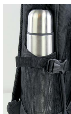
Nätficka på sidan