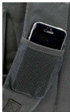
Mobilficka på axelband