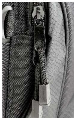
Materialmix och snygga detaljer